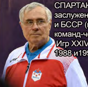
СПАРТАК МИРОНОВИЧ заслуженный тренер СССР и БССР (гандбол). Тренер команд-чемпионов Игр XXIV и XXV Олимпиады 1988 и 1992 гг.