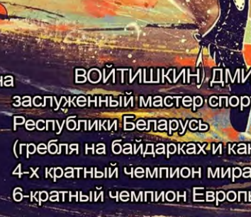
ВОЙТИШКИН ДМИТРИЙ заслуженный мастер спорта Республики Беларусь (гребля на байдарках и каноэ). 4-х кратный чемпион мира и 6-кратный чемпион Европы